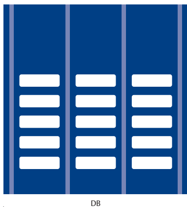
Afm. raam: 980 x 300 mm