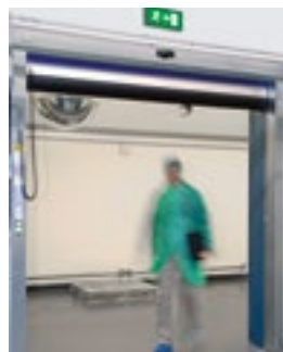
ASSA ABLOY RR300 Plus F+R uitgerust met radar met bewegingsdetectie.

1) Bij het F+R design is standaard een rolafdekking voor bevestiging van de radarsensor meegeleverd. Voor deuren met een hoogte van ≤ 2500 mm is een afdekking bovenrol vereist om te beantwoorden aan de eisen van de 13241-1 standaard. Voor hoogten van meer dan 3700 mm is een extra houder vereist die een maximale installatiehoogte van de radarsensor van 4000 mm mogelijk maakt.