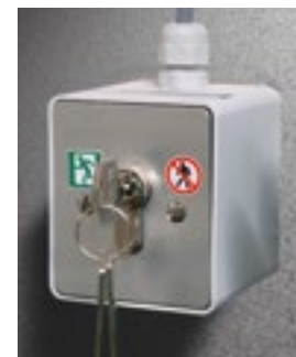
Schakelaar om de vluchtroutefunctie uit te schakelen.