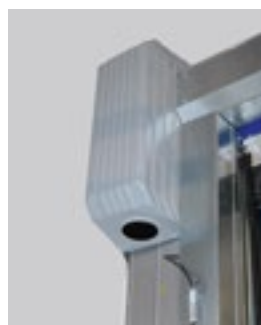
MCC-systeem met uitgebreide behuizing voor de nodige veiligheidsuitrusting.