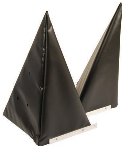
Hoekafdichting ES (driehoek)