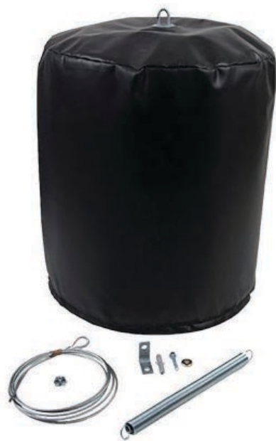
Hoekafdichting ESR (kussen)